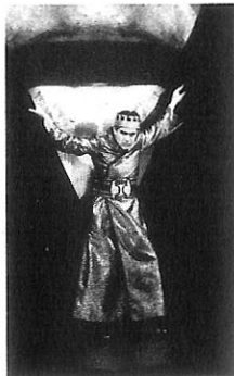
Neptun sitzt Idomeneo im Nacken